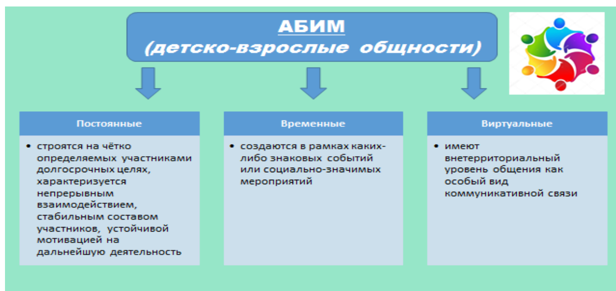
Рис.1 Модели детско-взрослых общностей «АБиМ»

Мы определили три модели детско-взрослых общностей: постоянную, временную и виртуальную (Рисунок 1).