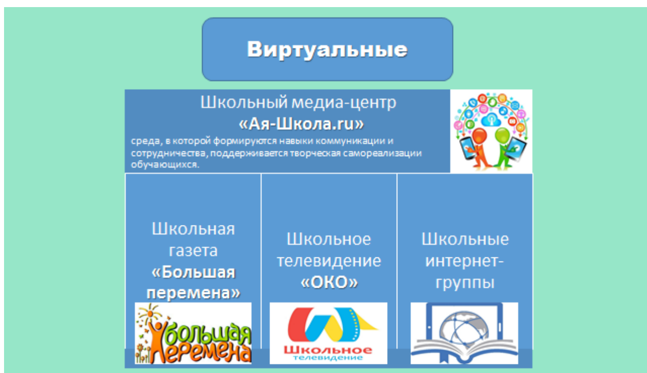
Рис.4 Виртуальные детско-взрослые общности

Виртуальная детско-взрослая общность (ВДВО) имеет внетерриториальный уровень общения как особый вид коммуникативной связи. ВДВО - школьный медиа-центр «Ая-Школа.ru» - среда, в которой формируются навыки коммуникации и сотрудничества, поддерживается творческая самореализация обучающихся. Медиацентр включает школьную газету, школьное телевидение, официальную страницу в социальных сетях (Рисунок 4).