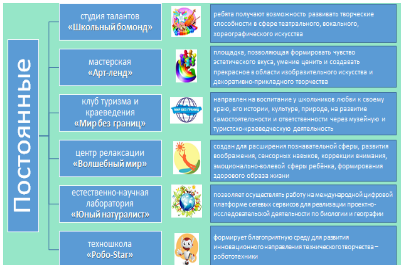
Рис.2 Постоянные детско-взрослые общности

Постоянная детско-взрослая общность (ПДВО) строится на чётко определяемых участниками долгосрочных целях, характеризуется непрерывным взаимодействием, непрерывным составом участников, устойчивой мотивацией на дальнейшую деятельность. К ПДВО относятся: студия талантов «Школьный бомонд», мастерская «Арт-ленд», клуб туризма и краеведения «Мир без границ», центр релаксации «Волшебный мир», естественно-научная лаборатория «Юный натуралист», техношкола «Робо-Star» (Рисунок 2).